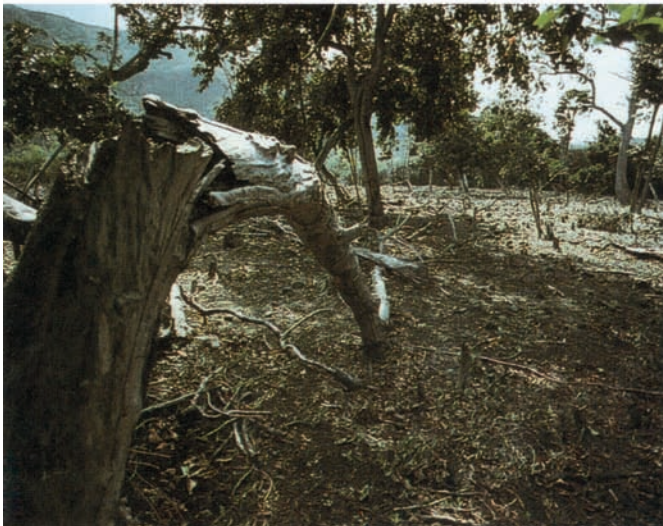
Šume Mauricijusa, nekada dom istrebljene ptice dodo, danas su i same na ivici istrebljenja.