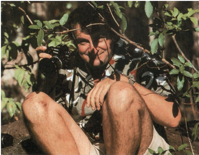
Daglas pokušava da slika žbun iznutra