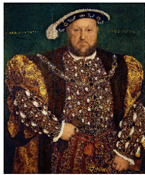
1827. Hans Holbein Mladi, Henri VIII , 1540. Ujle na drsci, 82,6 cm x 74,5 cm, Nacionalna galerija antičke umetnosti, Rim

isključivo autoritet Svetog pisma, dok su radikalniji reformatori zastupali stav da su slike idoli. Holbein je, želeći da izbegne takvu atmosferu, tražio posao na drugom mestu. Već je 1523-1524. godine putovao u Francusku, s namernom da svoje usluge možda ponudi kralju Fransoa I. Očekujući da dobije pozivnišine s dvora Henrija VIII otpustovao je 1527. godine u Englesku. Pomislila je Erasmov portret na paklam humanisti Tomasa Moreu, koji je postao njegov prvi zaštitnik u Londonu. Preporučujući Holbeina Erasmu je pisao Moreu: „Ovde (u Bazelu) umetnost se ne ceni.“ Kad se 1528. godine Holbein vratio u Bazel, retorika je već bilo zamenilo nasilje. Bio je svedok kad je protestantska rulja uništavala verske slike, a taj prizor Erasmu je opisao u jednom pismu: „Niječlan kip nije preostao u crkvanama... ni u manastirima; sve su freske