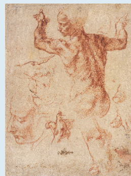
Mikelandelo. Studije za Ladjku sibilu. Crvena kređa na papiru, 28 cm x 21,5 cm. Metropolitanski muzej umetnosti, Njujork. Kupljeno. Zastavština Džozefa Pulicera, 1924. (24.197.2)

mreža koja će pomoći u kopiranju prikaza u većem obimu. Slike za freske mogle su se izbiti deli glavnih linija nacrtu; broz se amne rignio utiskivao se prah kako bi se nacrt preneo na zid. To se zvalo punkiranje. U XVII veku crteži su postali cenjeni po sebi pa su ih skupljali umetnici, meceni i poznavaoi umetnosti. Smatralo se da crteži otkrivaju neto što završeno delo ne može da otkrije; umetnikov postupak, njegovu ličnost i na kraju – njegov genije.