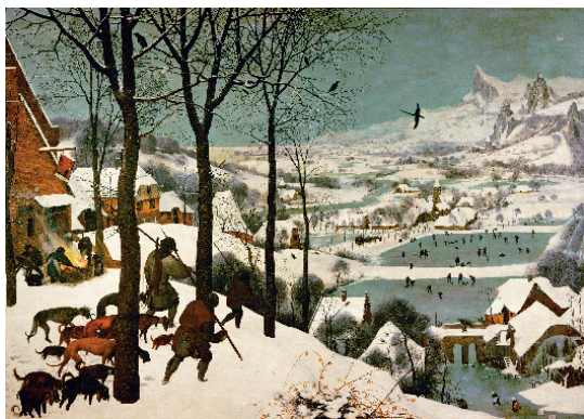
1837. Piter Brojgel Stariji, Ponudak leduca , 1568. Ujle na drsci, 117 cm x 162 cm. Umetničkoistorijski muzej, Beč

...Mnoge njegove kompozicije s humorističnom temom, koje su čudne verno slika prirodu ovde i u njenim drugim delima... Mnoga njegova dela nastala su u Antverpenu po porudžbini trgovca Hansa Frankarta, plemenitog i časnog čoveka kome je bilo prijatno u Brojgelovom društvu pa se s njim sastajao svak dan. Š Frankartom je Brojgel često odlazio na selo da posmatra seljake na vašarima i svadban. Preušli bi se u gosti i donosili darove kao i ostale zvanice tvrdeći da su mladi ili mladoženje prijatelji ili rođaci. Tu je Brojgel uživao