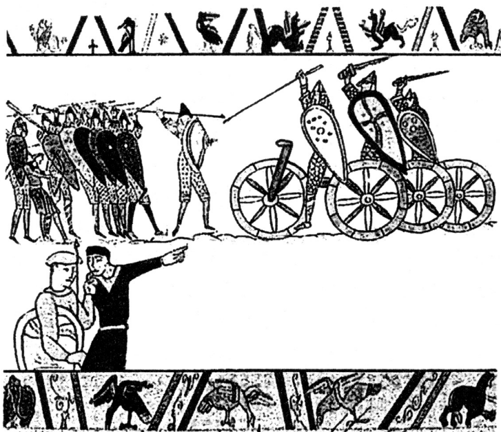
Privatna kolekcija, Milano: detalj tapiserije, nazvane „de Prioereski“ (mere celog originala 7 m × 1,10), potiče iz Normandije. Može se pretpostaviti da je nastala pre 1100. godine nove ere.