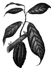
KAKAOVAC Theobroma cacao