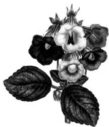
GLOKSI NIJA Gloxinia speciosa