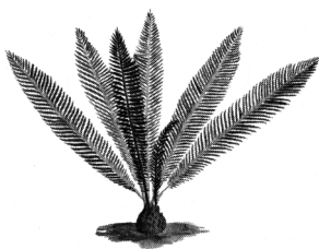
MEKSIČKA CIKADA Zamia furfuracea