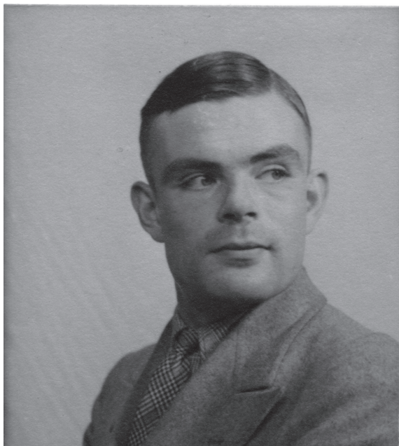
Alan Turing, 1930. godine na jednoj od fotografija snimljenih za pasoš

urezanim matematičkim simbolima i slikama, poput slike na kojoj muva istražuje Mebijusovu traku. Na okviru kamina bilo je zapisano Ajnštajново: „Raffiniert ist der Herr Gott, aber boshaft ist er niht“, što je fizičar H.P. Robertson preveo kao: „Bog je lukav, ali nije zloban“. Pojedini prozori bili su podeľjeni na poliedre, dok su na nekima bili vitraži s formulama, uključujući i E = mc^2 .