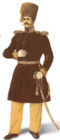
Војни чиновник у униформи (1837) ▲

После ратног пустошења, пожара и куге, у граду је 1815. године било свега шездесетак хришћана. Међутим, у време кнеза Милоша ситуација се постепено мења. Београд постаје нека врста обећане земље – људе су привлачили већа економска слобода, домаћа власт, нови послови, а неки су стизали у жељи да побегну од закона својих земаља. Српско становништво досељавало се из свих крајева Београдског пашалука, али и околних земаља, посебно из Аустрије. Град је све више добијао српско обележје и први пут Срби и муслимани живе једни поред других у приближно изједначеном броју. Док су представници српске и османске власти настојали да одржавају подношљиве односе, становништво је живело на граници између сарадње и нетрпељивости.