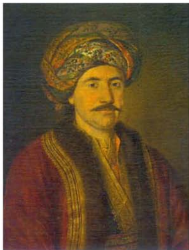
Павел Бурковић, Кнез Милош с турбаном

Ипак, застава Османског царства, као знак султановог суверенитета, вијорила се на тврђави до стицања самосталности Србије 1878. године.