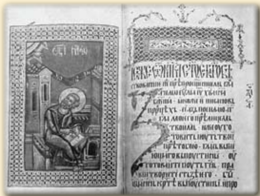
Четворојеванђеље, писано ирезвишер Цвейко, 1560., донето из Раче у Беочин