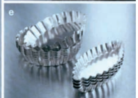
POSUDE ZA PEČENJE