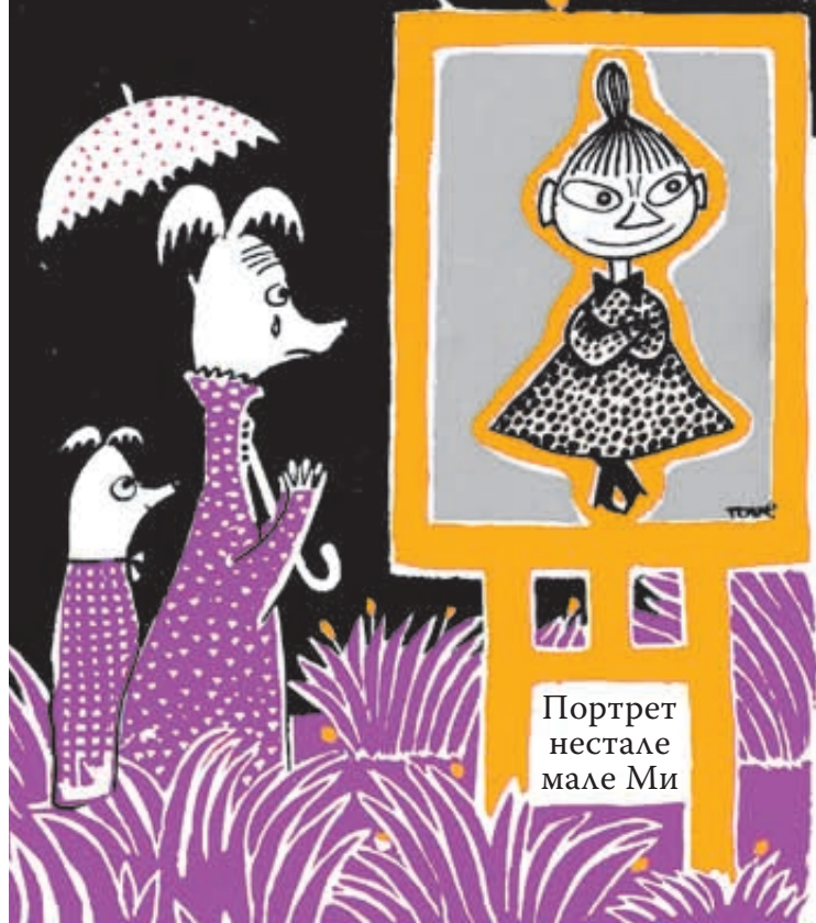
Портрет нестале мале Ми

То мамина кућа није, нећо Мимла сузе лије, на бурету старом седи, поквашену блузу цеди. Кроз сузе се тужно жада: – Сестра Ми ми нестала сада! – Мутин каже: – СЛУШАЈ, СТАНИ! МИМЛО ДРАГА, СУЗЕ МАНИ, САКРИЛА ЈЕ ХУЉА НЕКА, У БУРЕТУ МОЖДА ЧЕКА! ТАКО МИ СЕ УЧИНИЛО. – ЗНАШ ЛИ ШТА ЈЕ ОНДА БИЛО?