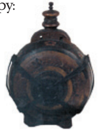
Чутура из Војводине, 19. век.

— Нећу, душе ми, јер сам код њега овако синоћ вечерао, па ме он научио да данас код тебе дођем на ручак!