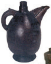
Судови за вино коришћени у Србији почетком 20. века.