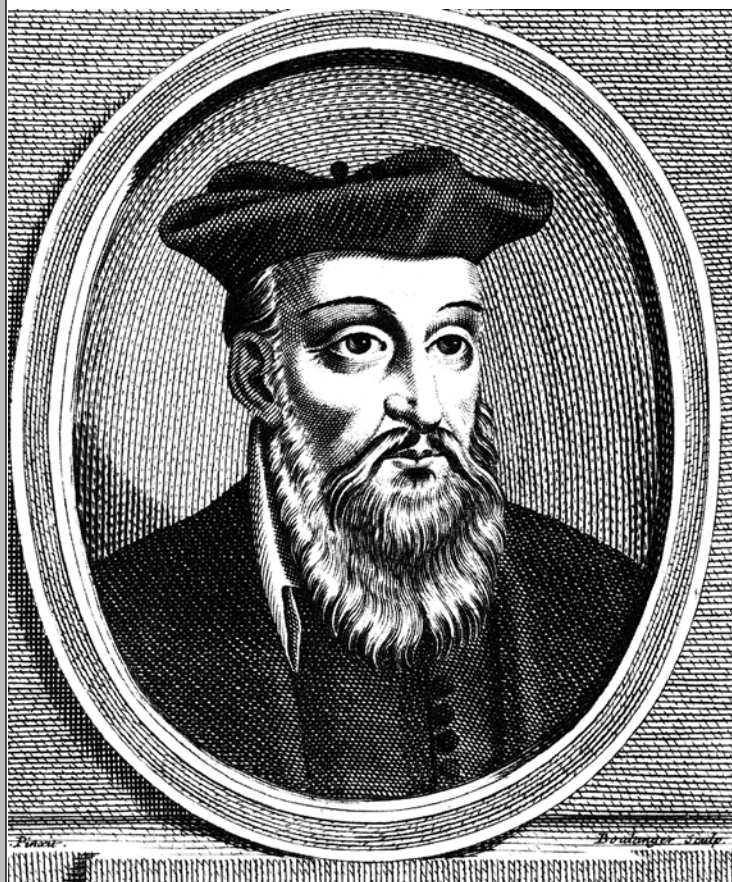
Nostradamus: prevara „stoleća“