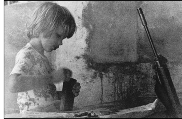
Bobo puni pušku

Mama kaže: „Ne šunaj nam se tako noću po sobi.“