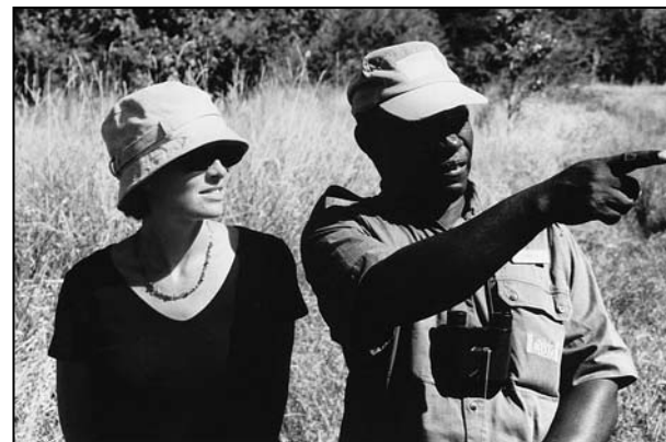
Bo i Kenet)

„A šta to voliš u Škotskoj?“, izazivam je.