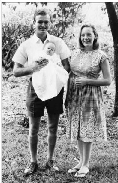
Mama, tata i Van: Kenija

drveće crne kore izlazi na dug, prašnjavi crveni put što vodi do Lusake, gde ga čekaju njegova lepa kuća podignuta u evropskom stilu, sluga koji je nekad služio u ambasadi i čuvar (u paru s obučenim nemačkim ovčarem). I tako će, umesto da se vrati u obezbeđeno predgrađe afričkog grada, presedeti do zore pijući s mamom.