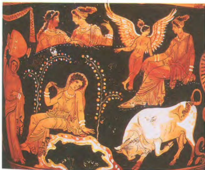
ZEVS, U OBLIČJU BIKA, OTIMA EVROPU DRUGA ČETVRTINA II Veka PRE NOVE ERE Keramička vaza iz Apulije

Jupiter je najveći bog rimskog panteona. Poistovećen je sa Zevsom kao vrhovnim bogom. Nazivaju ga Optimus Maximus , „veoma veliki i veoma do-bri“. Uspostavljanje kulta se vezuje za Romula: u toku bitke između Rimljana i Sabinjana, Romul, pokazujući nebu svoje oružje, obećava da će podići Jupiteru hram na samom mestu gde se nalazio, ukoliko se napredovanje neprijatelja zaustavi. Rimljani pobeđuju, a hram Jupitera Statora (koji zaustavlja) uzdiže se u podnožju Kapitola. Kao vrhovnom bogu rimske države, Jupiteru se zaklinju konzuli kada stupaju na dužnost, a imperatori posebno poštuju njegov kult. Avgust je tvrdio da mu se pojavljuje u snu.