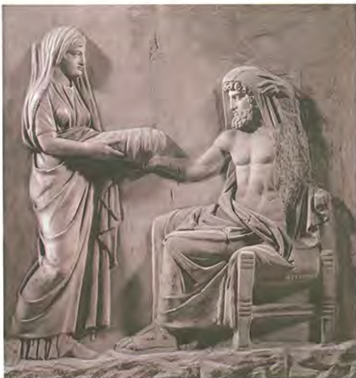
ZEVSOVO RODENJE II VEK, HADRIJANOVO DOBA Reljef na postamentu, mermor

Zevs je i garant poretka među bogovima i među ljudima. Presuđuje u sukobima: između Apolona i Herakla oko vlasništva nad delfskim tronošcem, između Apolona i Ide oko toga kome će pripasti Marpesa; između Palade i Atene prilikom njihove borbe; između Atene i Posejdona oko prevlasti nad Atikom; između Afrodite i Persefone oko Adoniseve ljubavi. On ne pravi ustupke, njegove su odluke pravedne i uravnotežene.