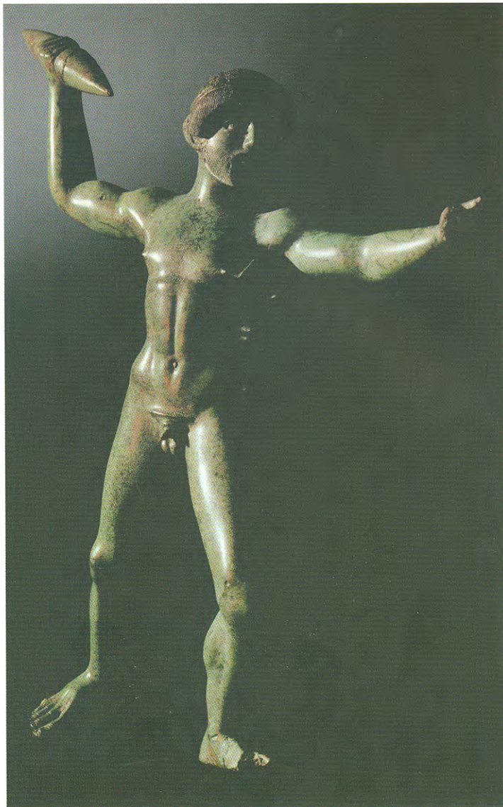
Po Hesiodu, munje kojima se služi Zevs iskovali su kiklopi Argej, Bront i Sterop.

Od kralja Olimpa stoički filozofi su načinili simbol jedinog boga. Tako Kleant (232. pre n. e.) kaže: „Ti si tako vrhovni gospodar vasione da se, ništa na Zemlji ne dešava bez tebe, ništa na eteričnom nebu, ništa u moru.“ (Himna Zevsu).