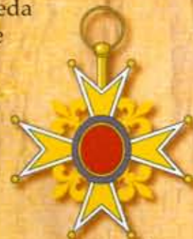
Orden Reda svetog Luja

Žan Bar je kao dvanaestogodišnjak otišao u mornare. Sa šesnaest godina postao je poručnik na brodu Sočno prase , a 1672. kralj Luj XIV naložio mu je da napada holandske brodove. Žan Bar je svojim Delfinom naoružanim sa 14 topova uspeo da savlada holandsku ratnu krstaricu, ogroman brod sa četiri jarbola i 32 topa. Odneo je toliko pobeda u službi kralja da je na kraju proglašen vitezom Reda svetog Luja .