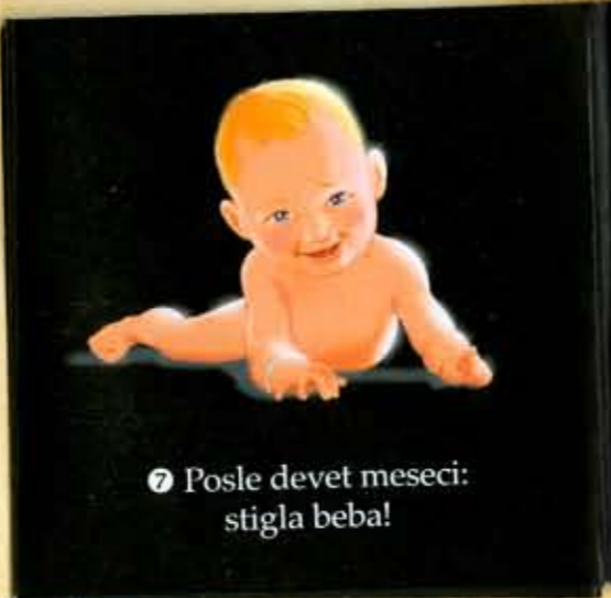
7 Posle devet meseci: stigla beba!

Potraži među nalepnicama mamu ili tatu ove dece i zalepi sličice pored njih.